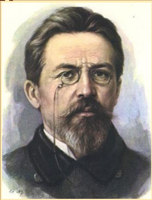
Чехов Антон Павлович (1860-1904)