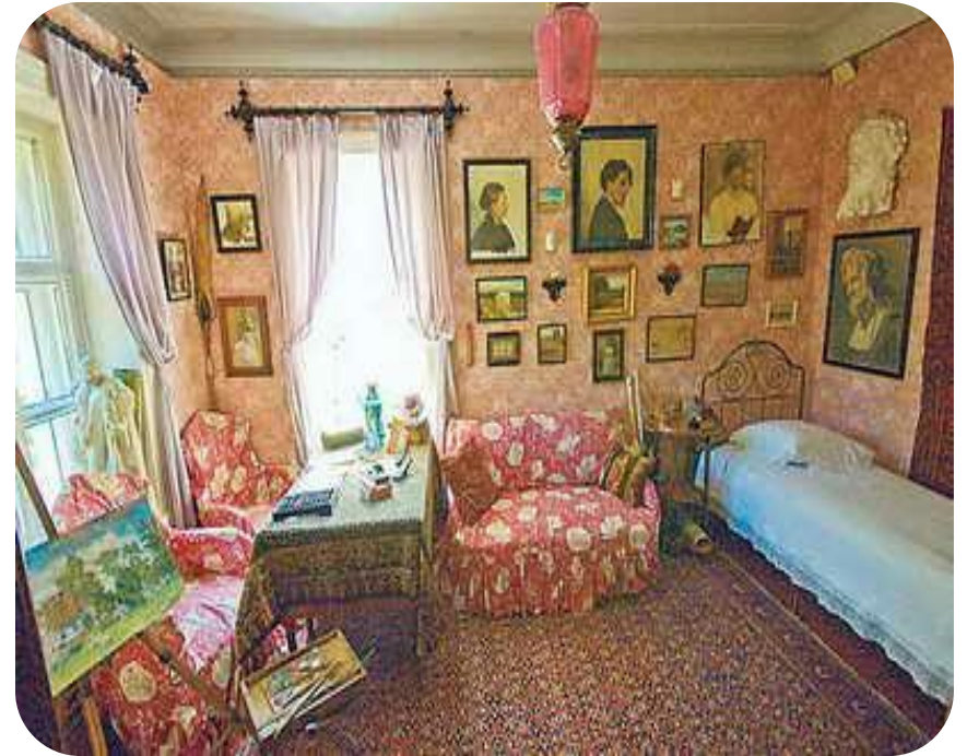
Будинок А.П. Чехова в Ялті