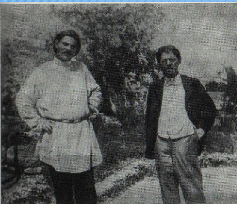
А. М. ГОРЬКИЙ и А. П. ЧЕХОВ Ялта, 1900 г.

Частым гостем Антона Павловича был М. Горький, считавший знакомство с Чеховым «самым ценным подарком судьбы».