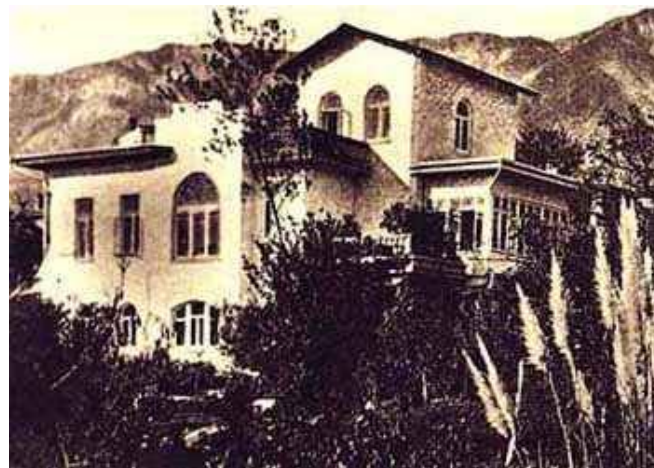
Дім Чехова в Ялті