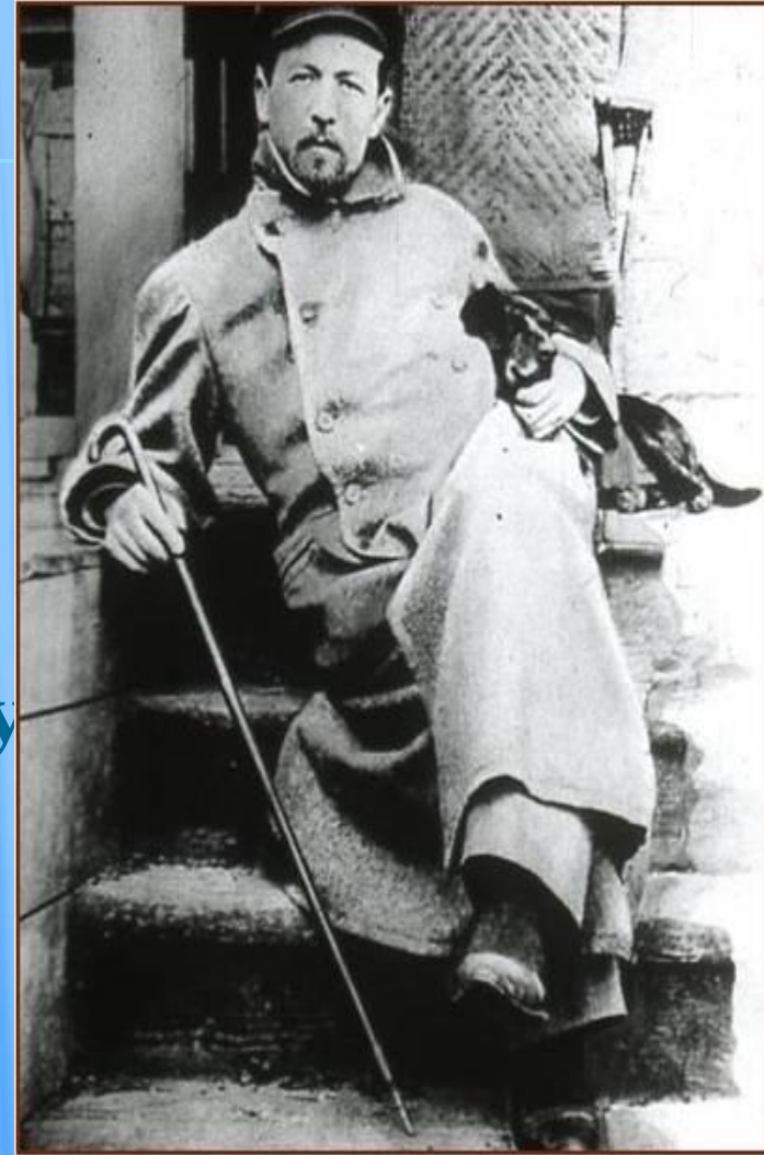
А.П. Чехов по возвращении из клиники

□ Весной 1897 года у Чехова началось резкое обострение туберкулезного процесса, давно беспокоящего его здоровье. В больнице Чехова посетил Л.Н. Толстой: «В клинике был у меня Лев Николаевич, с которым вели мы преинтересный разговор... Говорили о бессмертии». После чего Антон Павлович умирает.