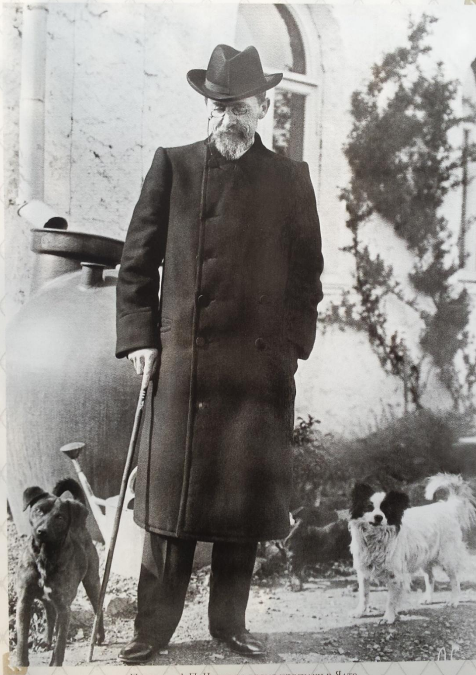
Писатель А.П. Чехов во время прогулки в Ялте. 1901 г.