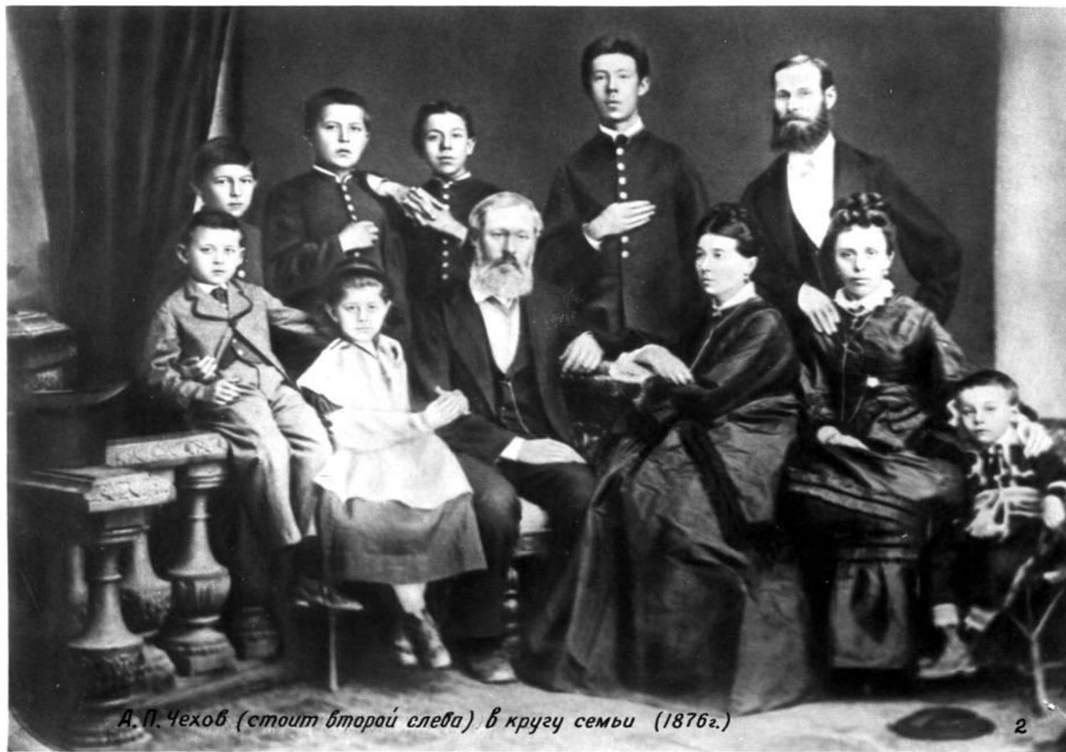
А. П. Чехов (стоит второй слева) в кругу семьи (1876г.)