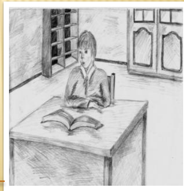
Рис. Мостовой Наташи

Сквозь подтекст чеховского рассказа слышится мысль писателя о том, что надо быть внимательнее к своему ребёнку и не доверять его будущее сомнительным людям.