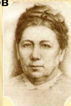
Мать — Евгения Яковлевна Чехова. Рис. С.М. Чехова

«Талант в нас со стороны отца, а душа со стороны матери».