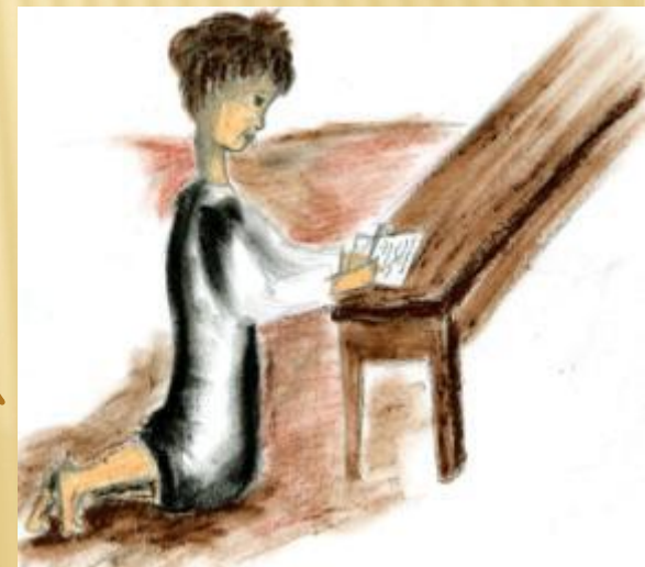
Рис. Бражниковой Насти

Дед – забыл о внуке Хозяин и хозяйка – бьют, заставляют прислуживать по хозяйству, нянчить ребёнка, сапожному ремеслу не учат