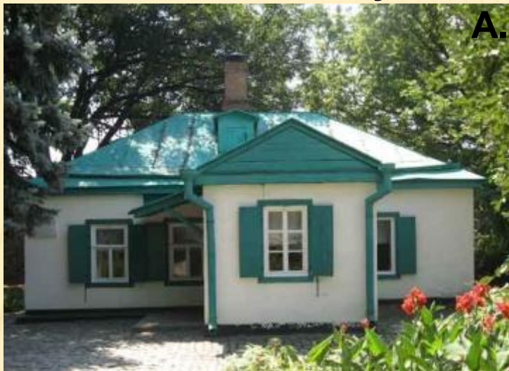
Таганрог. Дом, в котором родился Чехов