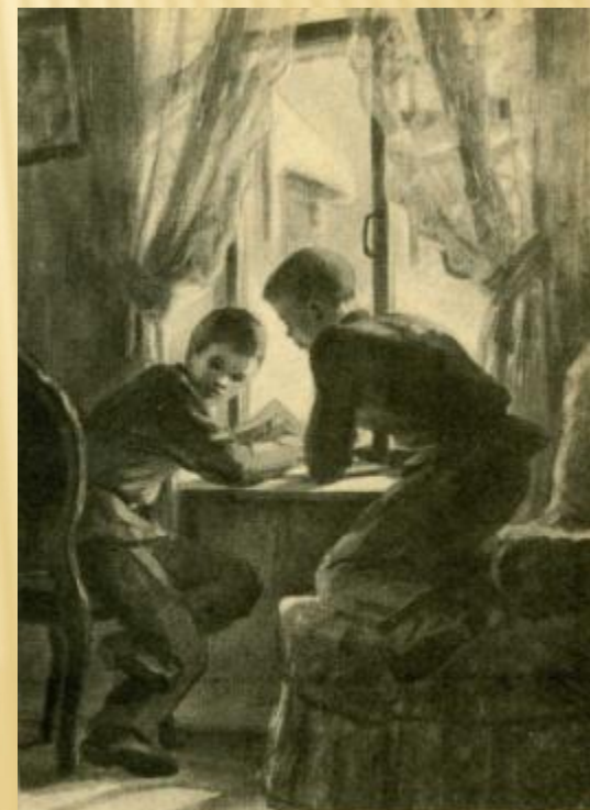
— Сначала в Пермь...— тихо говорил Чечевицын...— оттуда в Тюмень... потом в Томск.

Нежелание причинить боль маме – перед этим меркнет даже романтическая затея, как бегство в Америку