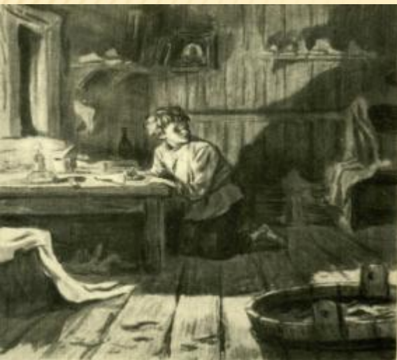
Рис. Т. Гапоненко

Ванька – девятилетний мальчик, сирота, отдан сапожнику Аляхину в обучение