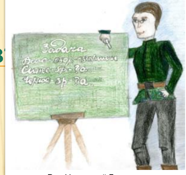
Рис. Ульяновой Лизы