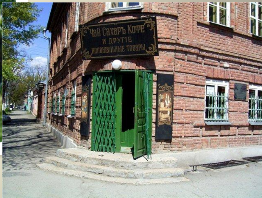
Лавка семьи Чеховых