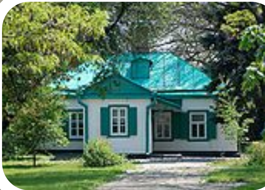
Отчий дом писателя в Таганроге

Детство и юность писателя прошли в Таганроге.