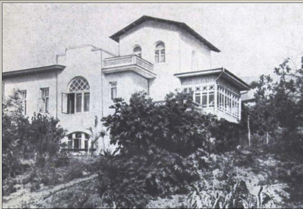
Дом в Ялте

Памятник Антону Павловичу в Ялте Приморский парк.