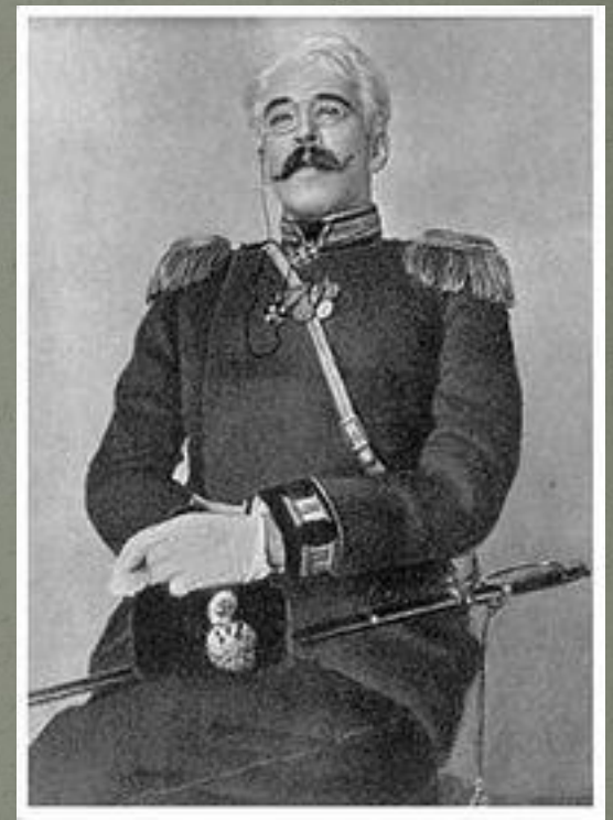
Станиславский в роли Вершинина.

Работу над спектаклем в Художественном театре начинал К. С. Станиславский, — снова, как и в предыдущих постановках, ключом к спектаклю для него стало «раздвоение мира», «противоречие поэзии и прозы». По собственному признанию режиссёра, работа шла тяжело, и был момент, когда пьеса «не звучала, не жила, казалась скучной и длинной»