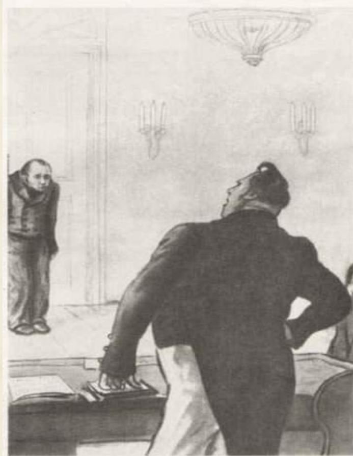
71. Акакий Акакиевич у значительного лица Художники Кукрыниксы, 1952 г., б., черная акварель