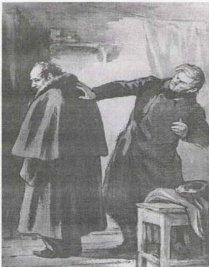
70. Акакий Акакиевич примеряет новую шинель Художники Кузрыники, 1952 г., в., черная акварель