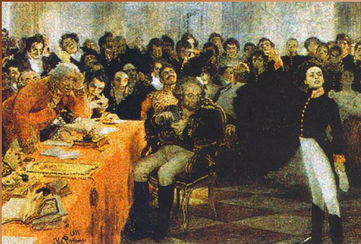
И. Репин, 1911

Воспитанник Царскосельского лицея 15-летний Александр Пушкин в день публичного экзамена, переходного в старший класс, привел в восторг всех присутствовавших чтением своего стихотворения «Воспоминания в Царском Селе». Знаменитый русский поэт Гаврила Романович Державин, пораженный талантом юноши, склонил перед ним голову.