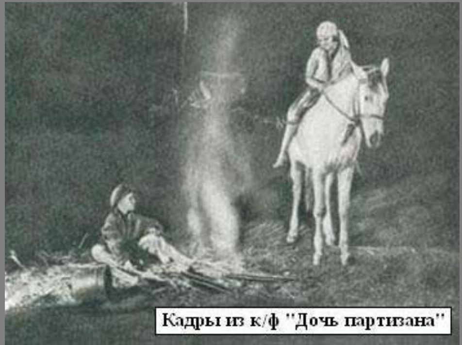
Кадры из к/ф "Дочь партизана"