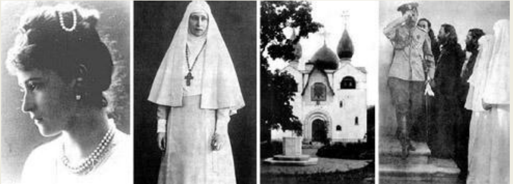
Великая княгиня Елизавета Феодоровна, основательница Марфо-Мариинской обители