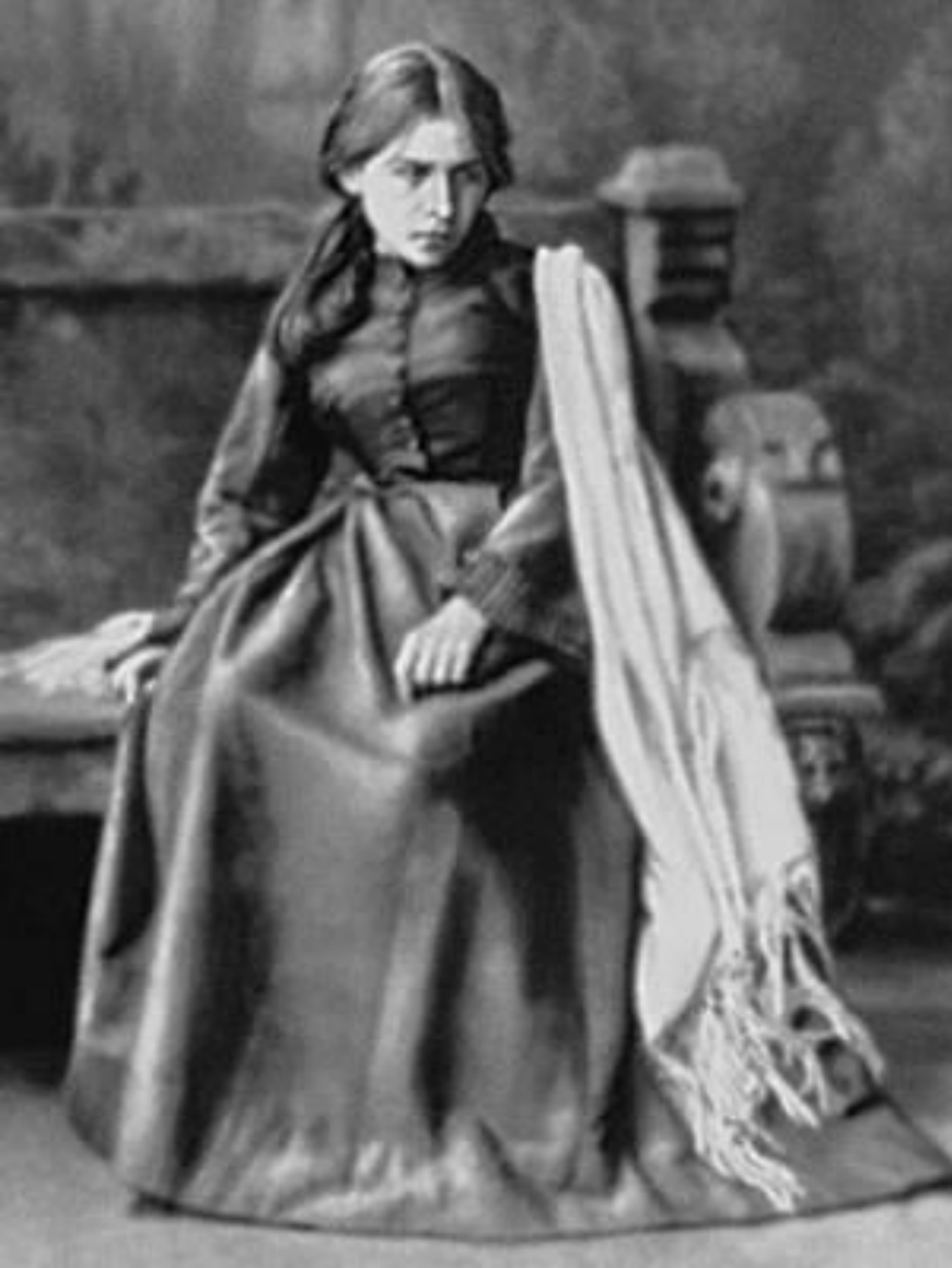
П.А. Стрепетова в роли Катерины