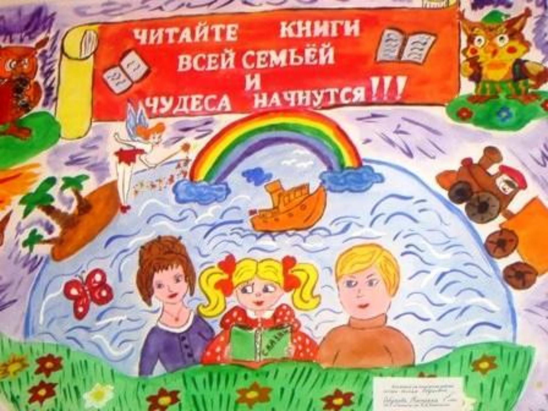
Иллюстрация Людмила Баранова © 2000

ЧИТАЙТЕ КНИГИ ВСЕЙ СЕМЬЕЙ И ЧУДЕСА НАЧНУТСЯ!!!