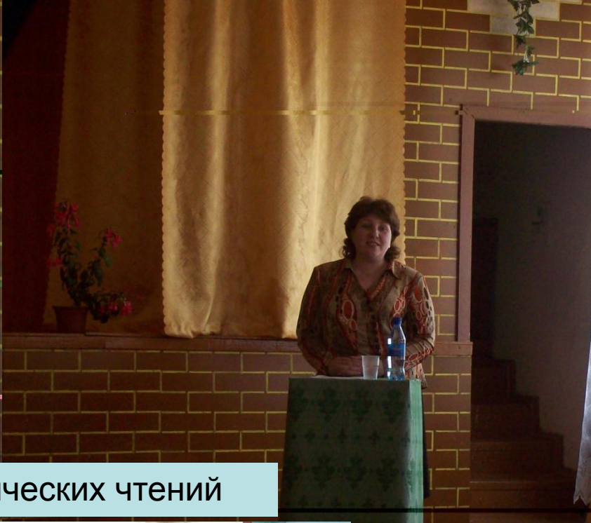
Участники педагогических чтений