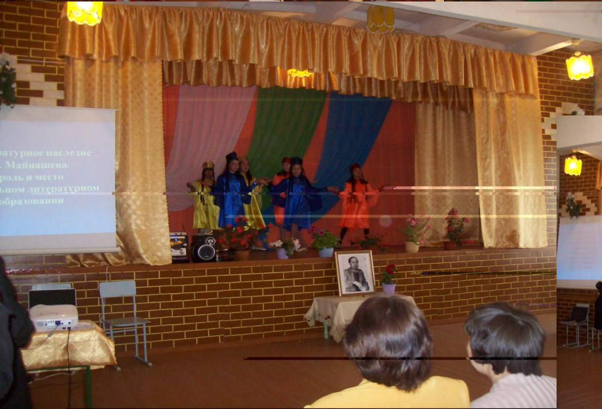
Приветствия участников Майнашевских чтений песнями, стихами и танцами