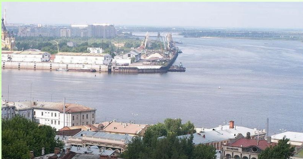
Ока, впадающая в Волгу в Нижнем Новгороде

В России красивые реки: Нева, Усманка, Калитва, Лена и Ока.