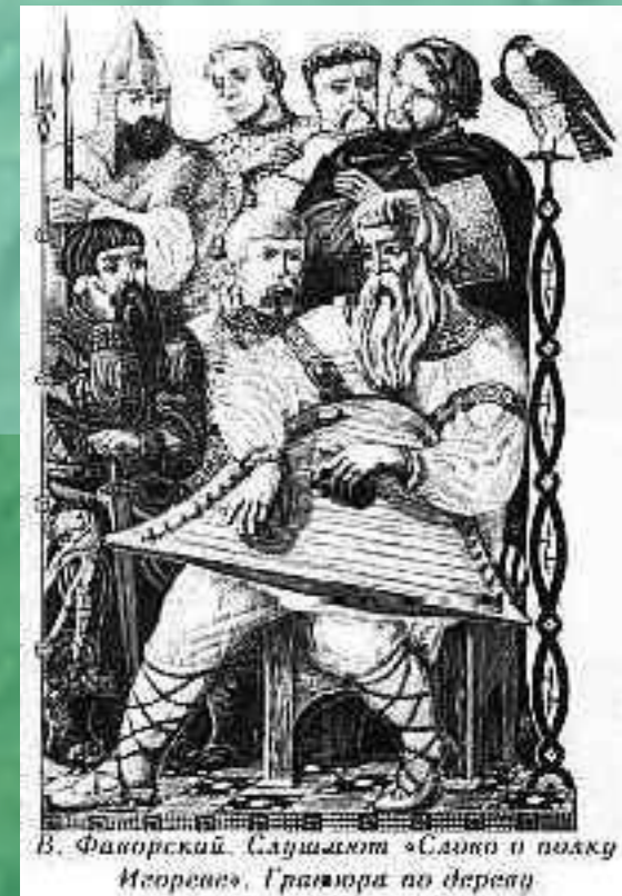
В. Фаворский. Служащие «Слова о полку Игореве». Гравюра по дереву

■ “Слово о полку Игореве” является историческим памятником древнерусской литературы. Это величайшее произведение своего времени. “Словом о полку Игореве” нам с большой точностью передан образ Древней Руси. В него входят характеры русских людей, описания природы, мирного труда. Главным чувством, волновавшим автора “Слова о полку Игореве”, была любовь к Родине, к русской земле, к народу. Автор скорбит о разъединении Великой Руси. Он - великий русский мыслитель рисует разные слои народа XII века. Он противопоставляет их смелость, доблесть, и трудолюбие стремлению князей к обособлению. В “Слове о полку Игореве” описаны страдания простого народа от набегов половцев.