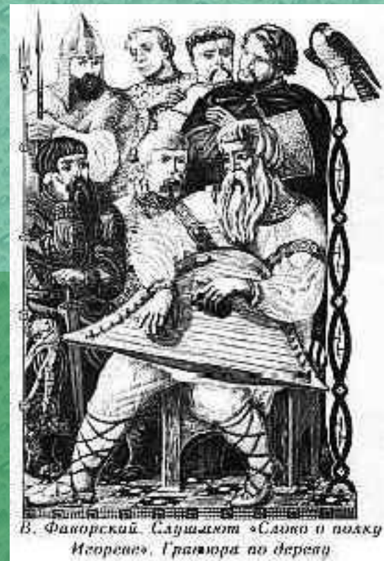
В. Фаворский. Случайно «Слово о полку Игореве». Гравюра по дереву

■ “Слово о полку Игореве” является историческим памятником древнерусской литературы. Это величайшее произведение своего времени. “Словом о полку Игореве” нам с большой точностью передан образ Древней Руси. В него входят характеры русских людей, описания природы, мирного труда. Главным чувством, волновавшим автора “Слова о полку Игореве”, была любовь к Родине, к русской земле, к народу. Автор скорбит о разъединении Великой Руси. Он - великий русский мыслитель рисует разные слои народа XII века. Он противопоставляет их смелость, доблесть, и трудолюбие стремлению князей к обособлению. В “Слове о полку Игореве” описаны страдания простого народа от набегов половцев.