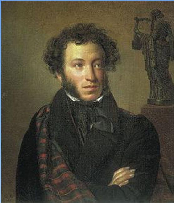
Александр Сергеевич Пушкин