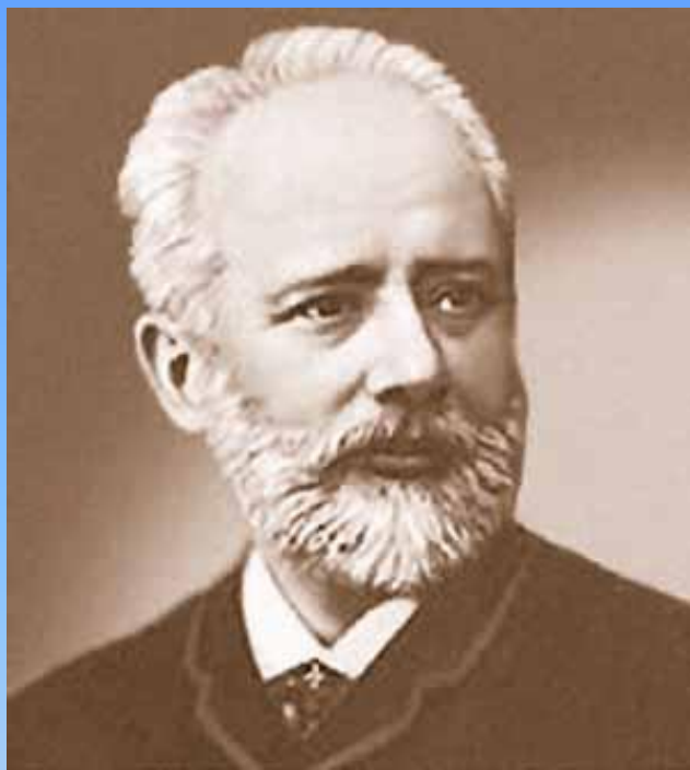
Пётр Ильич Чайковский