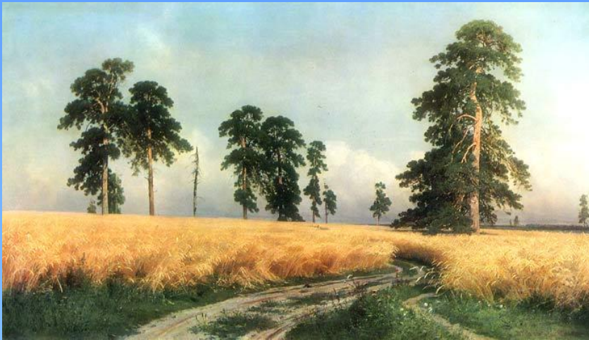
Иван Иванович Шишкин «Рожь»