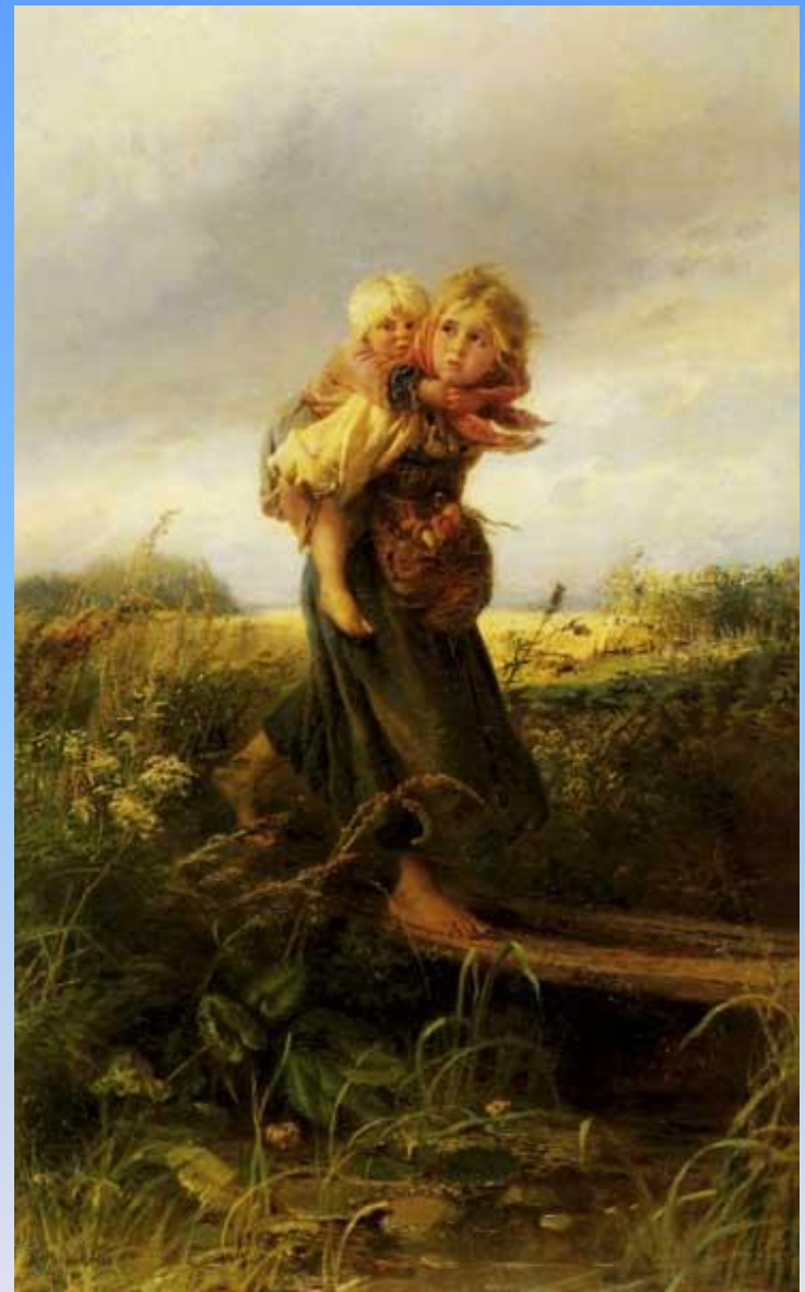
Маковский Константин Егорович «Дети, бегущие от грозы».