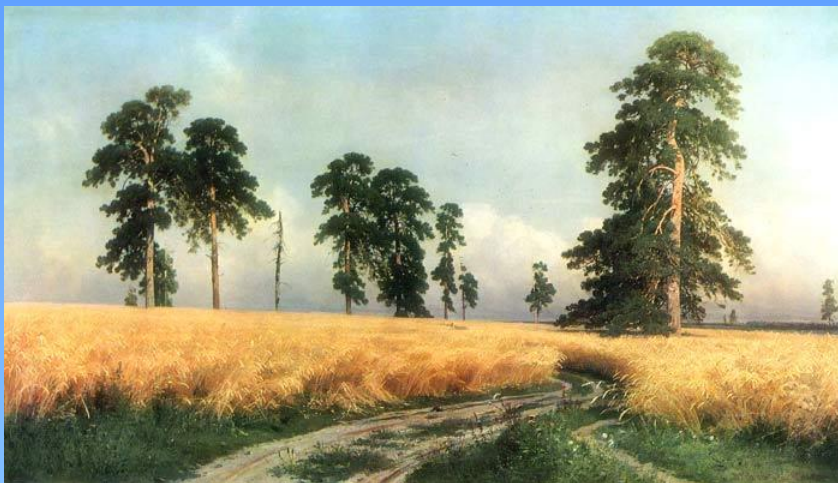
Иван Иванович Шишкин «Рожь»