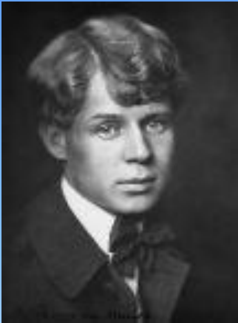
Сергей Александрович Есенин.