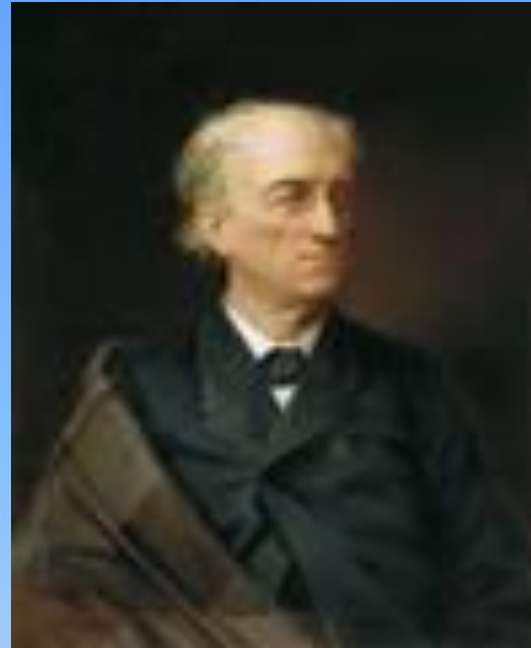
Фёдор Иванович Тютчев