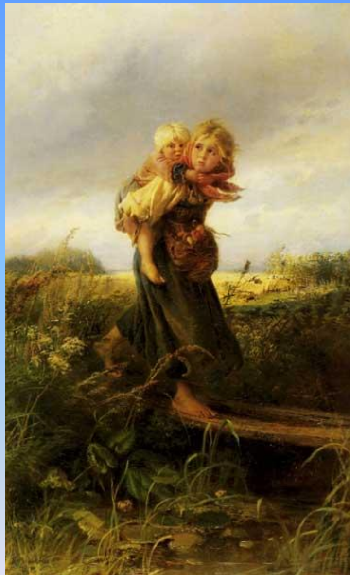
Маковский Константин Егорович «Дети, бегущие от грозы».