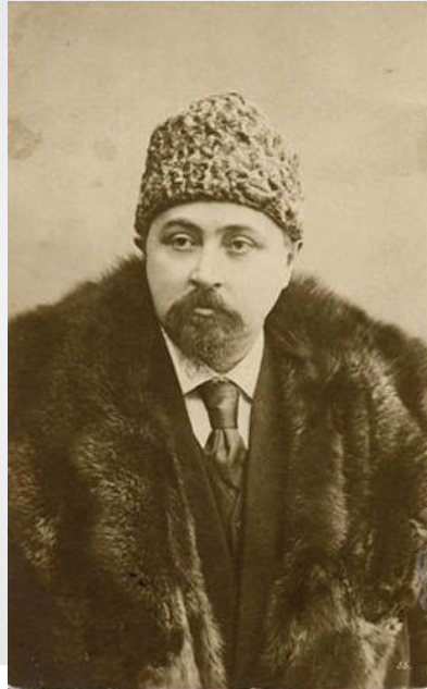
Дмитрий Наркисович Мамин-Сибиряк 1852 - 1912