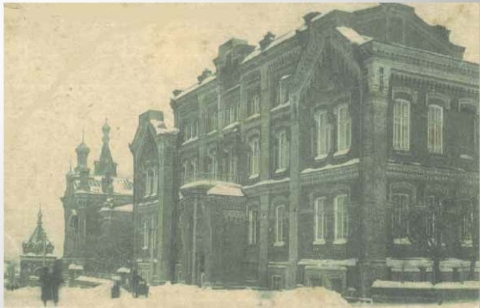
Пермская духовная семинария

В 1866г. был определён в Екатеринбургское духовное училище. Затем 4 года отучился в Пермской духовной семинарии. Потом будущий писатель учился на ветеринара в Петербургской медико-хирургической академии, затем на юридическом факультете Петербургского университета. Но, проучившись год, вынужден быть оставить из-за материальных трудностей и резкого ухудшения здоровья (начался туберкулез).