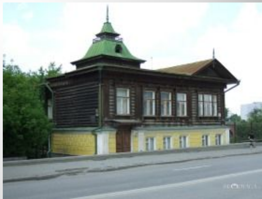
Дом, в котором жил писатель в Екатеринбурге

Летом 1877 вернулся на Урал, к родителям. В следующем году умер отец, и вся тяжесть забот о семье легла на Мамина-Сибиряка. Чтобы дать образование братьям и сестре и суметь заработать, решено было переехать в крупный культурный центр. Был выбран Екатеринбург, где начинается его новая жизнь.