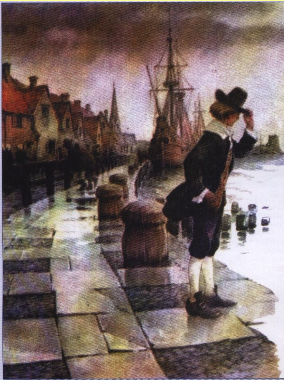
Робинзон в порту