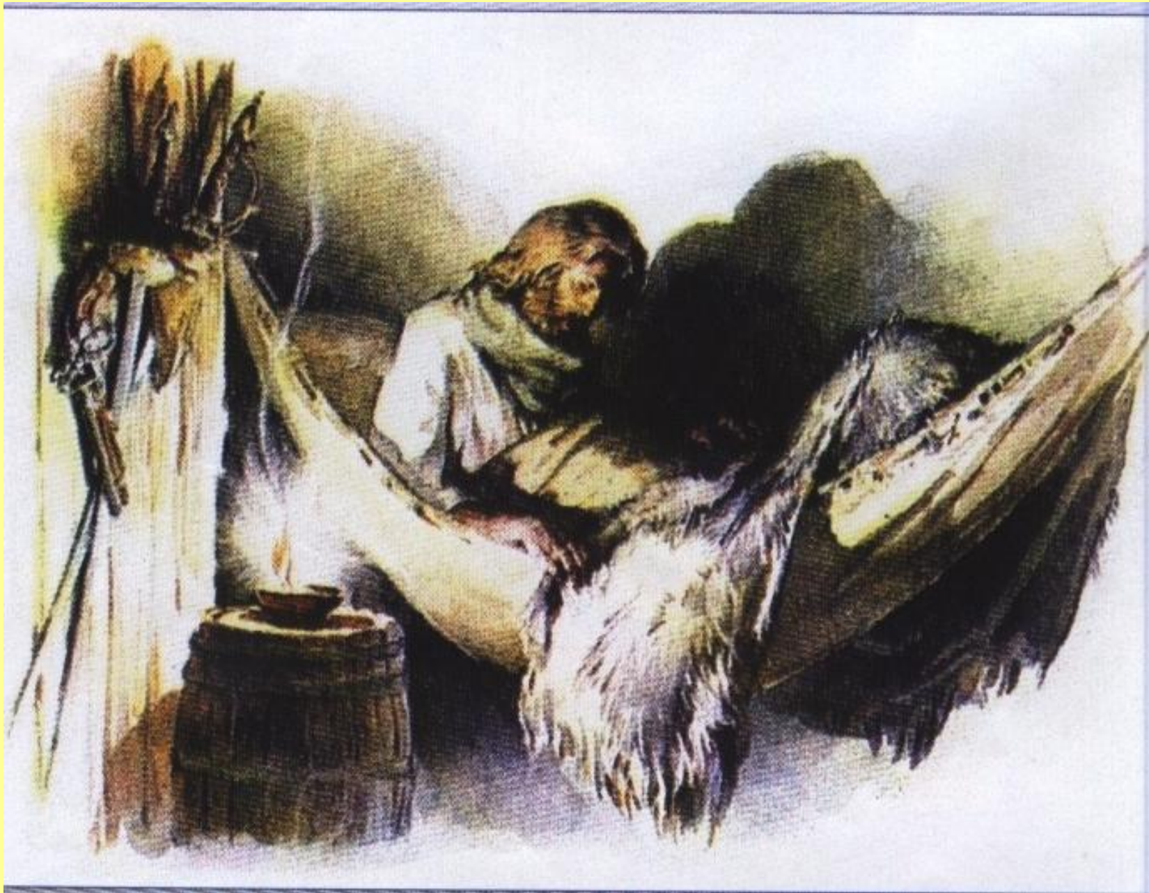
Робинзон в гамаке