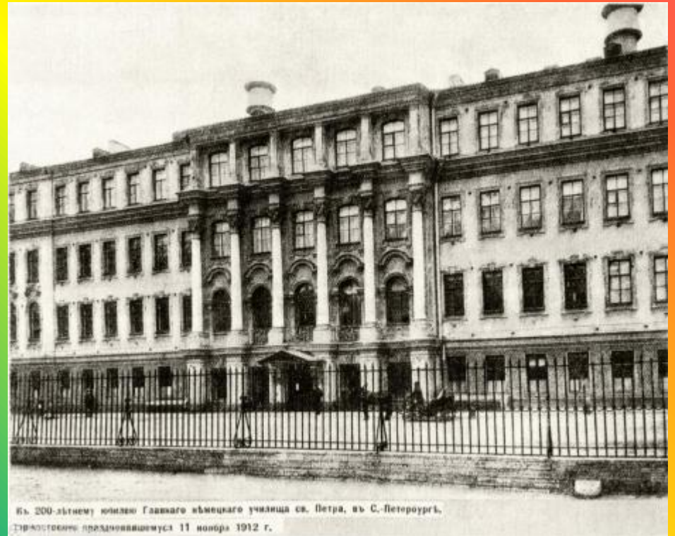
Въ 200-лѣтнему юбилей Главнаго немецкаго училища св. Петра, въ С.-Петербурѣ, Губернское предпринимается 11 ноября 1912 г.