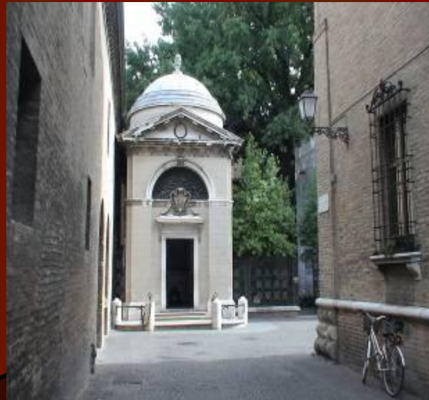
Мавзолей в Равенне