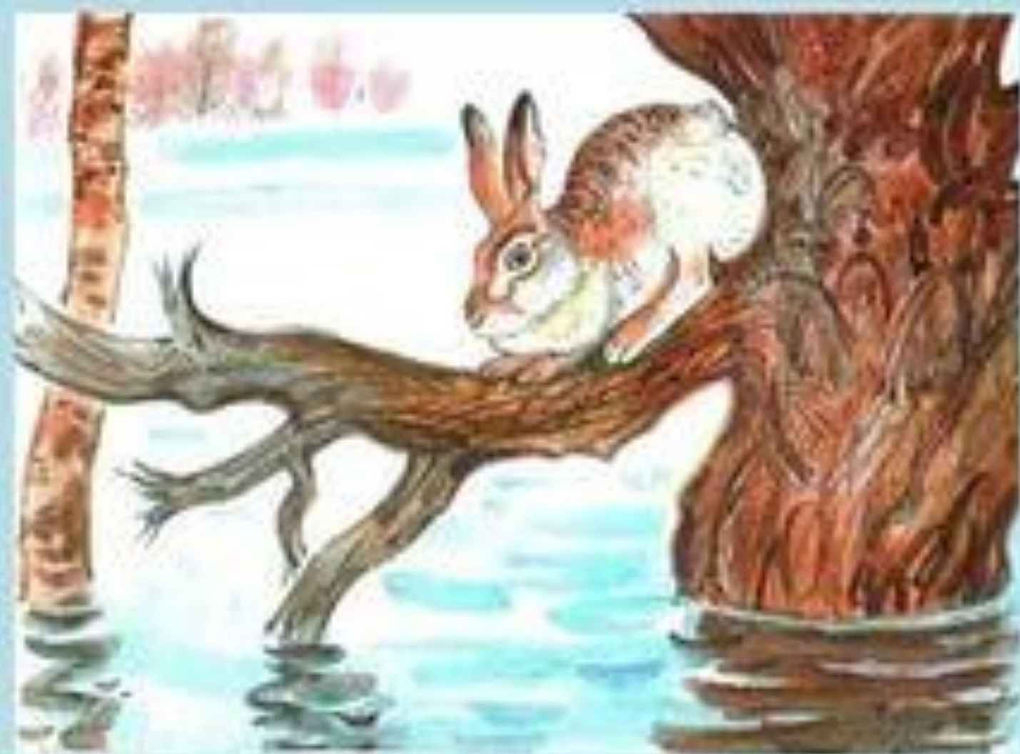
Картина А.Н.Комарова «Наводнение»