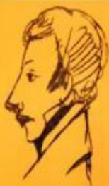
Рисунок А. Пушкина В. К. Кюхельбекер, друг Пуш- кина. 1826