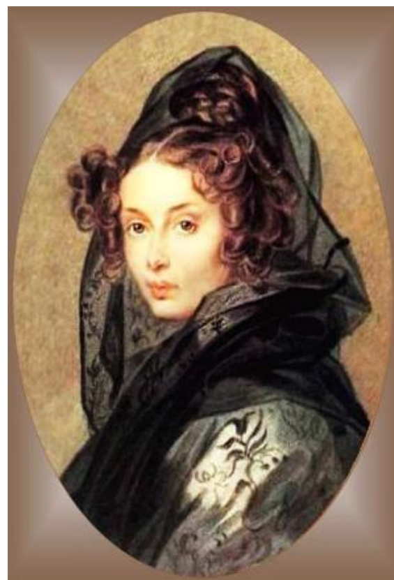
Никита Муравьев и его жена Александра Муравьева, которая привезла декабристам в Сибирь стихотворение А.С. Пушкина