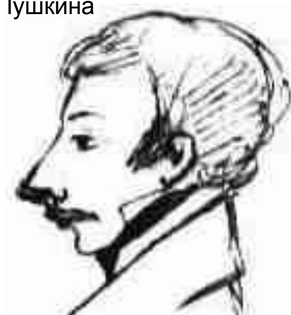
Кюхля. Рисунок Пушкина