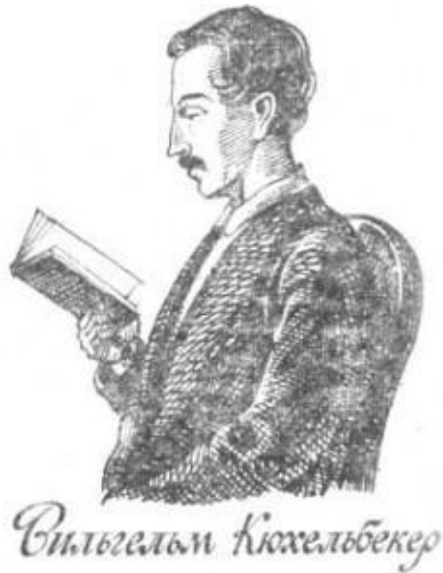
Кюхля. Рисунок Пушкина