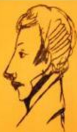
Рисунок А. Пушкина В. К. Кюхельбекер, друг Пушкина. 1826