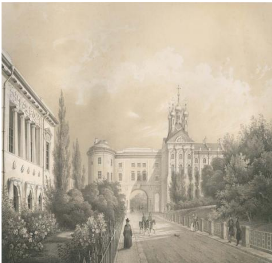
Императорский Царскосельский лицей, где учились друзья