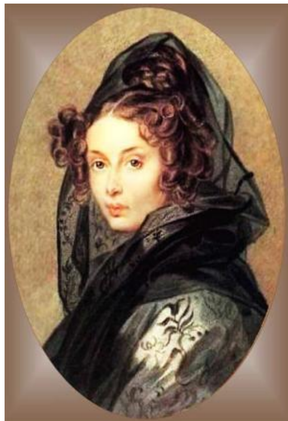
Никита Муравьев и его жена Александра Муравьева, которая привезла декабристам в Сибирь стихотворение А.С. Пушкина