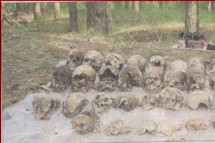
В годы политических репрессий были расстреляны тысячи воронежцев (фото сделано летом