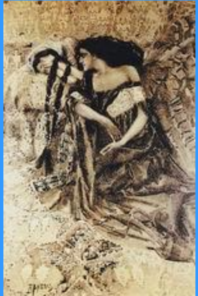
Тамара и Демон