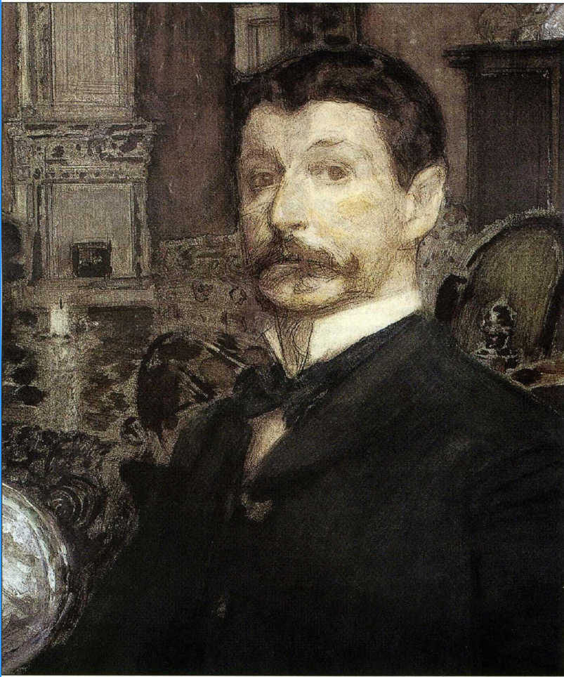
М.А.Врубель. Автопортрет с раковиной

Никто из иллюстраторов Лермонтова ни до, ни после Врубеля не подошел к его творческому и философскому мирозерцанию так близко, как это удалось художнику, заколдованному «Демоном» Лермонтова и своим собственным.