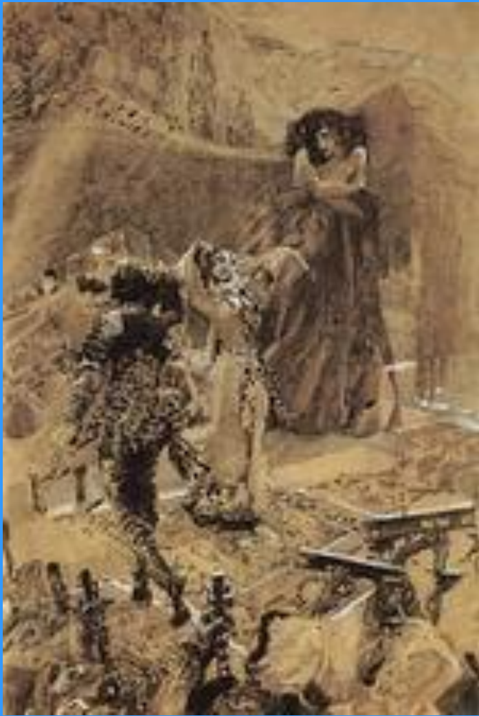
Демон, смотрящий на танец Тамары