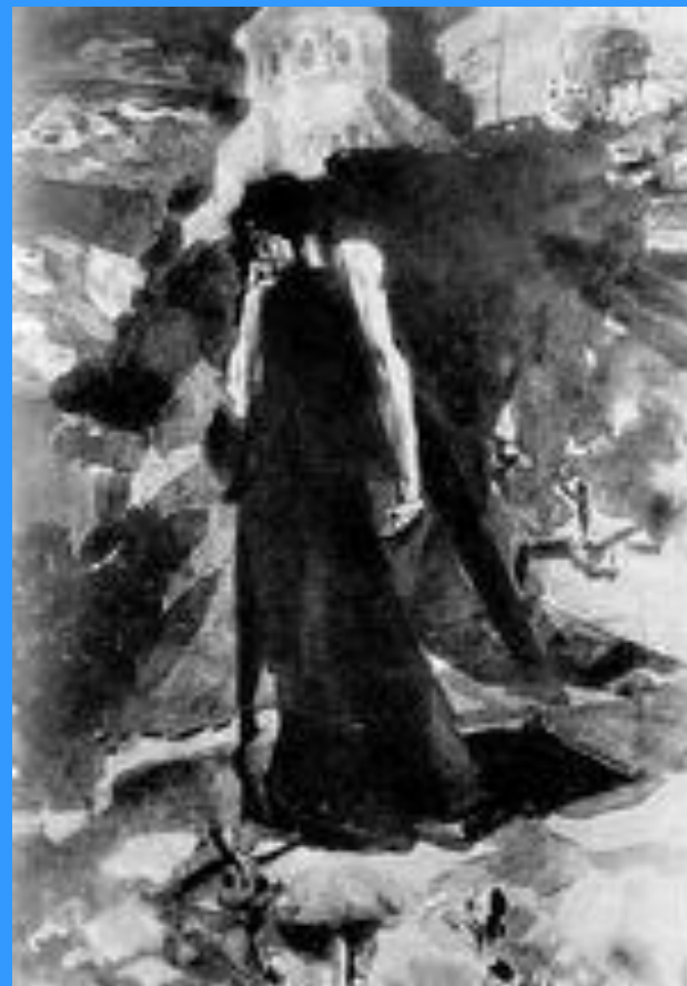
Демон у стен монастыря