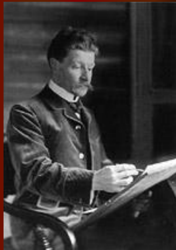
М. А. Врубель