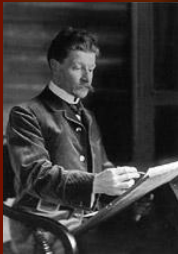
М. А. Врубель