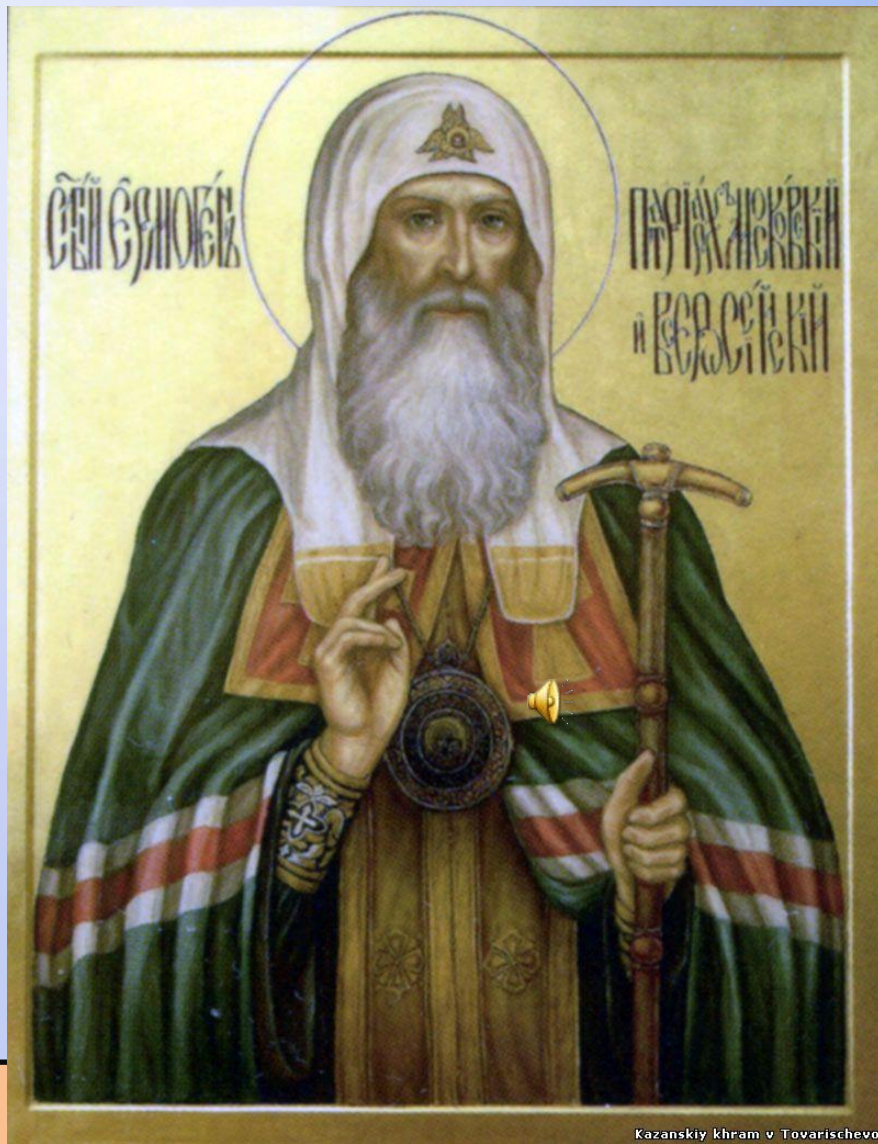
Kazanskiy khram v Tovarischevo