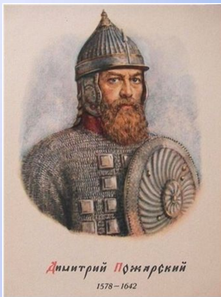
Дмитрий Пожарский 1578-1642

Дмитрий Пожарский (1 ноября 1578 г. — 30 апреля 1642 г.) - русский национальный герой, военный и политический деятель, глава Второго народного ополчения, освободившего Москву от польско-литовских оккупантов.