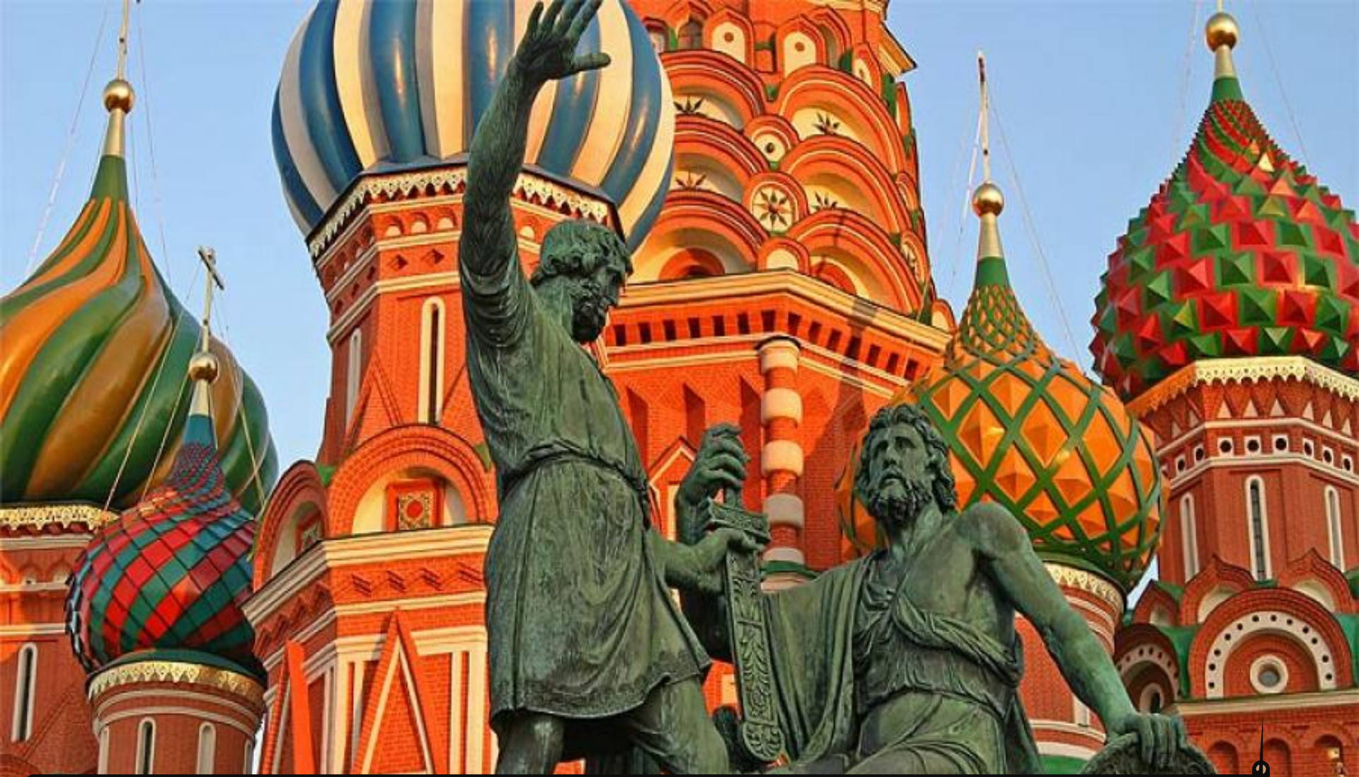
Памятник Минину и Пожарскому в Москве