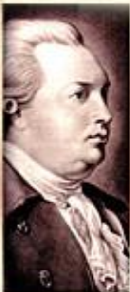
Д. И. Фонвизин Комедии

Автор негодует на порок И клеймит его без пощады.