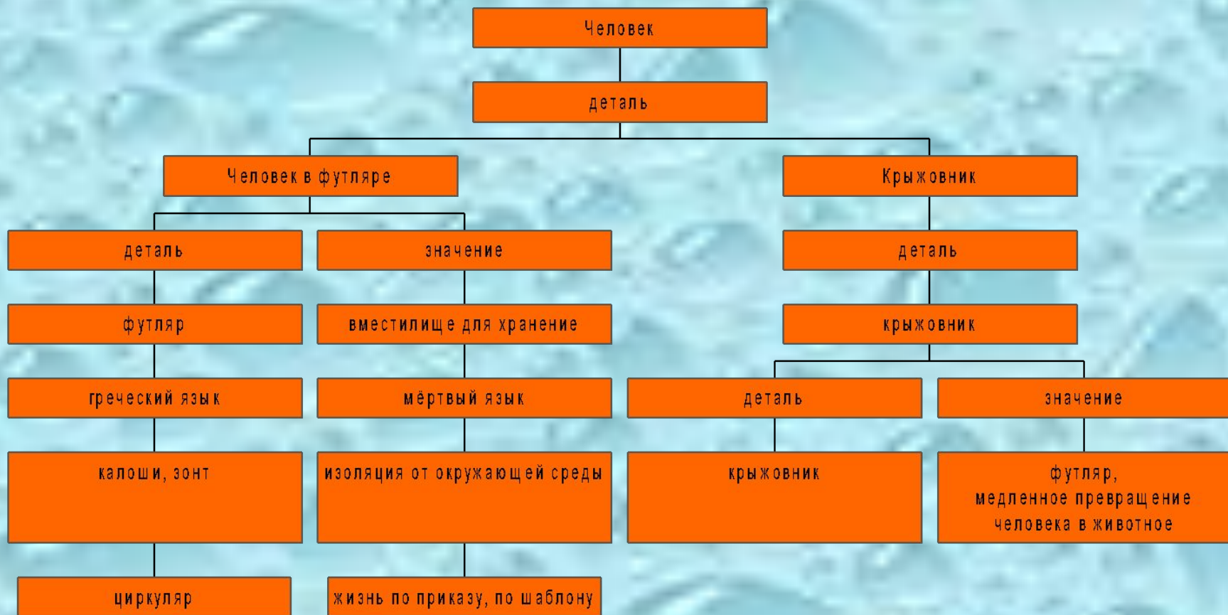
Схема деталей в трилогии Чехова