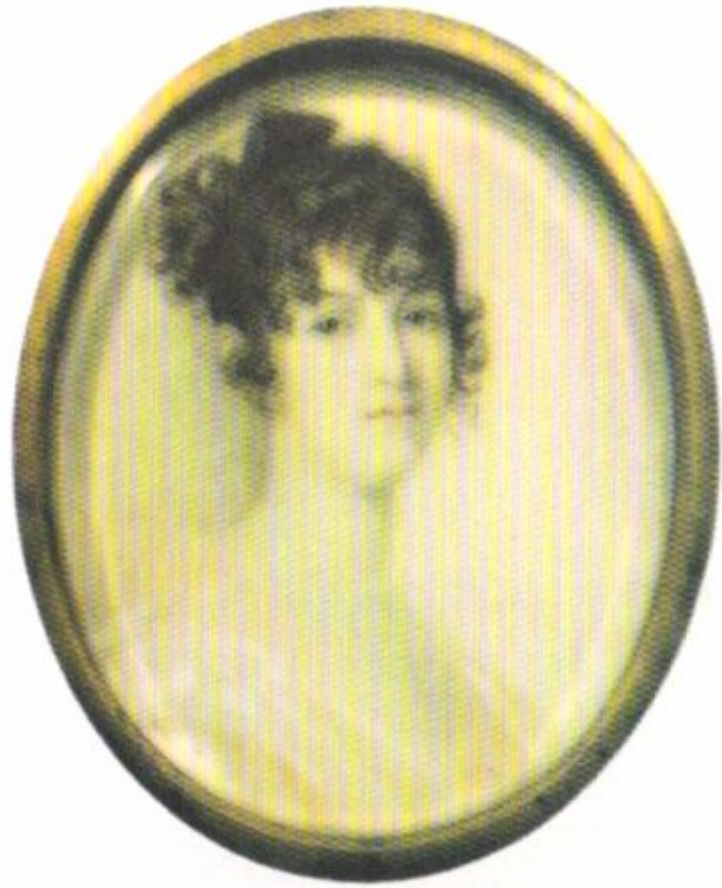
Н. О. Пушкина

Мать Пушкина была внучкой знаменитого Ибрагима Ганнибала. Она была красива. Характер имела самый неровный, с резкими сменами настроений. Любимцем ее был младший сын Лев. В Александре мать раздражало все: упрямство, неповоротливость, его непонятная сложность.