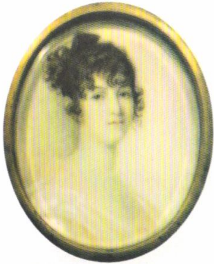
Н. О. Пушкина

Мать Пушкина была внучкой знаменитого Ибрагима Ганнибала. Она была красива. Характер имела самый неровный, с резкими сменами настроений. Любимцем ее был младший сын Лев. В Александре мать раздражало все: упрямство, неповоротливость, его непонятная сложность.