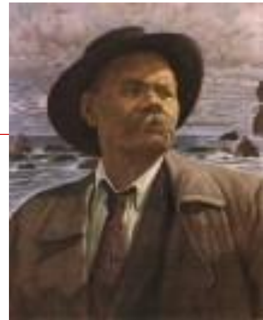
Бродский И.И. 1937

Любите книгу, она облегчит вам жизнь....она научит вас уважать человека и самих себя, она окрыляет ум и сердце чувством любви к миру, к человеку.