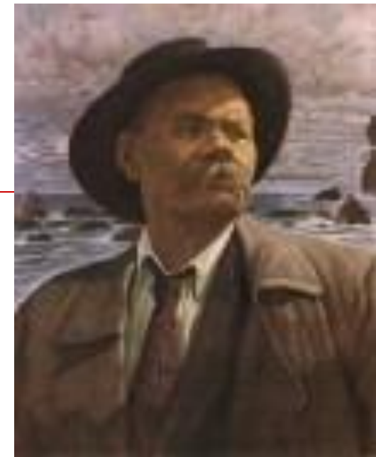
Бродский И.И. 1937

Любите книгу, она облегчит вам жизнь....она научит вас уважать человека и самих себя, она окрыляет ум и сердце чувством любви к миру, к человеку.