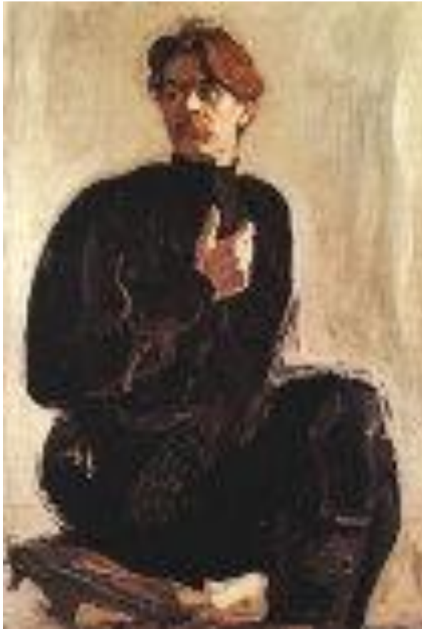
Портрет Горького работы В. Серова 1905г.