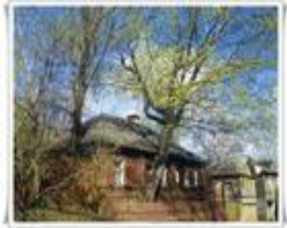
Дом деда Каширина