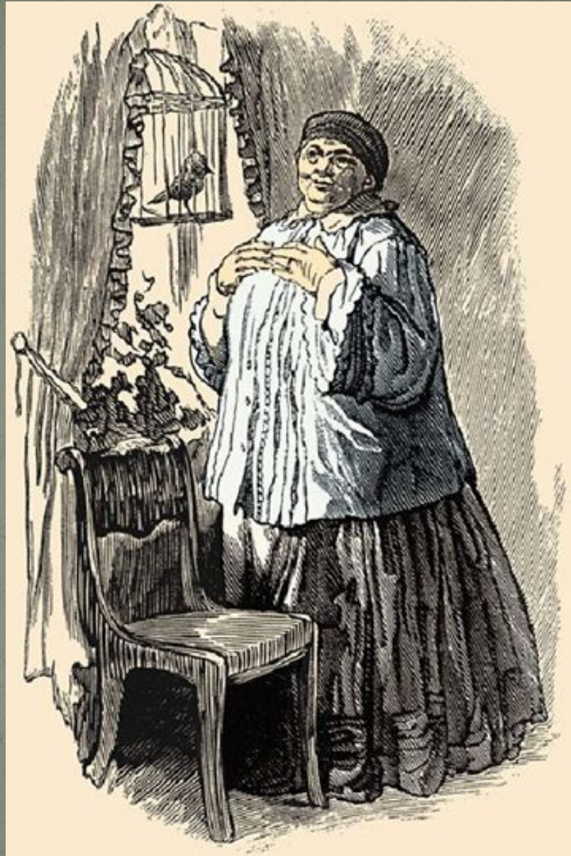
Иллюстрация художника Б. А. Дехтерева к повести М. Горького «Детство»