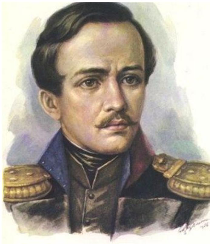
ДЕТСТВО Михаила Юрьевича Лермонтова