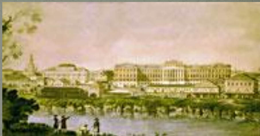
Здание университета 1786 г.

В соответствии с планом М.В. Ломоносова в Московском университете были образованы 3 факультета: философский, юридический и медицинский. Свое обучение все студенты начинали на философском факультете, где получали фундаментальную подготовку по естественным и гуманитарным наукам. Образование можно было продолжить, специализируясь на юридическом, медицинском или на том же философском факультете.