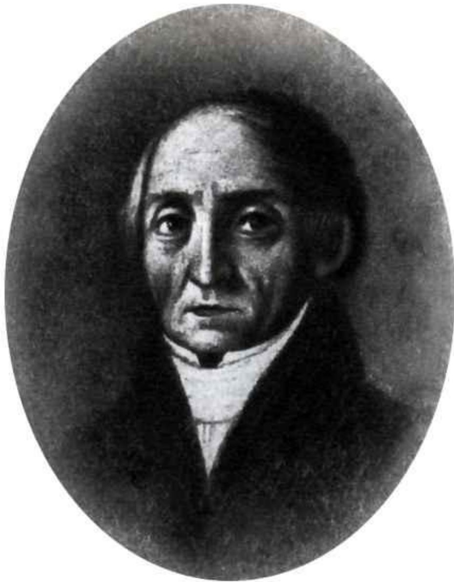
Отец писателя- Евграф Васильевич Салтыков