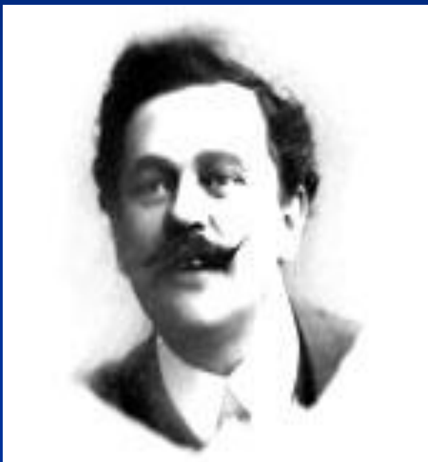
Владимир Леонидович Дуров