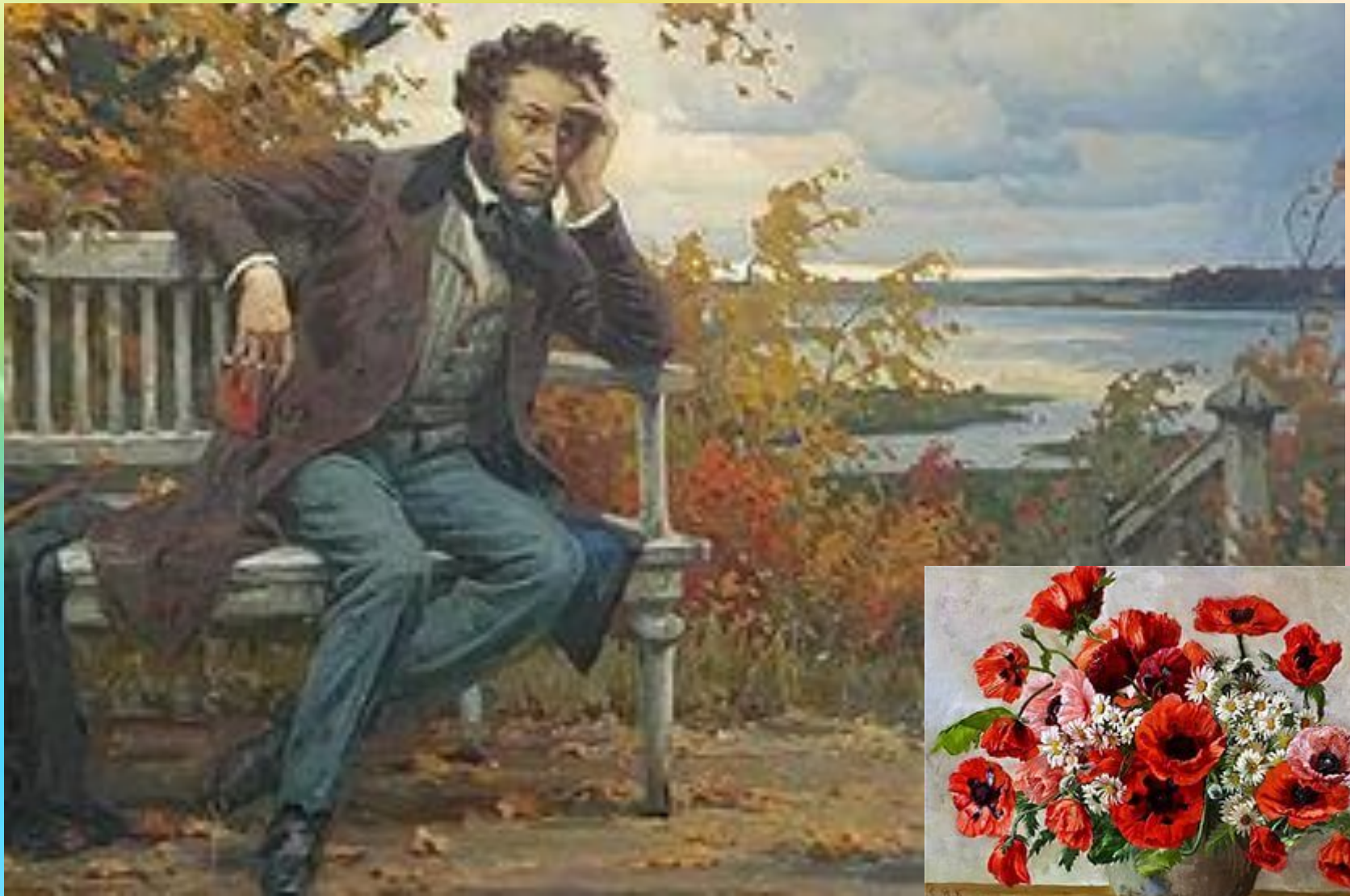
Великий русский поэт Александр Сергеевич Пушкин