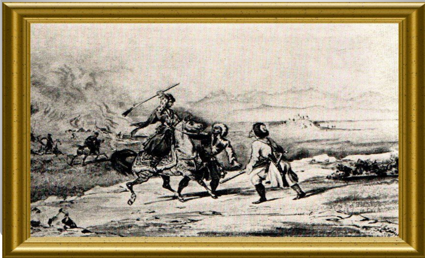
М.Ю. Лермонтов 1840г.