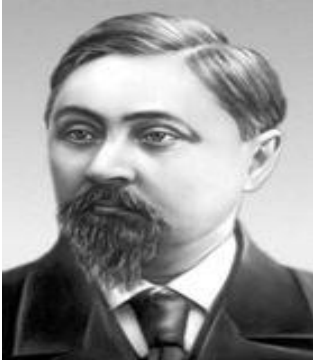
Дмитрий Наркисович Мамин – Сибиряк