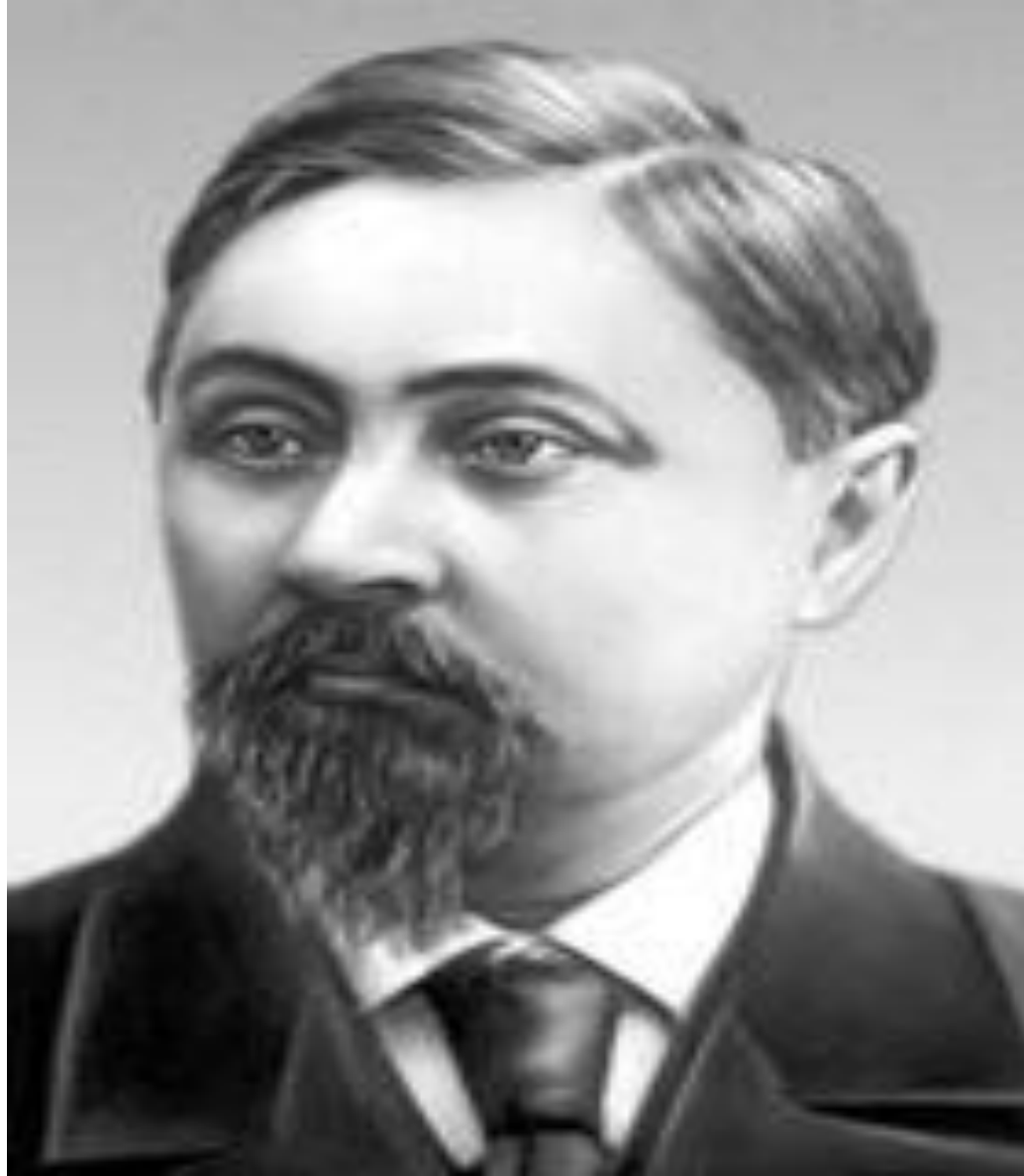
Дмитрий Наркисович Мамин – Сибиряк