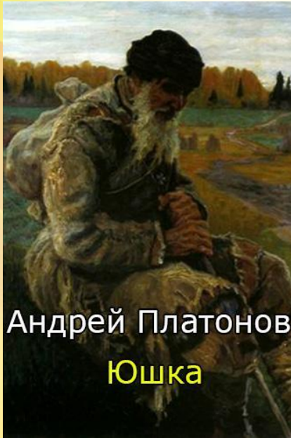
Андрей Платонов Юшка

Это рассказ о человеке, который обладает редким даром любви. всю жизнь Юшку бьют, оскорбляют и обижают. Но он никогда не проявлял злобы к людям, жил любовью к природе, людям, а особенно любовью к Даше, к сироте, которую он вырастил, выучил в Москве. Став врачом, девушка приехала в городок к Юшке, чтобы вылечить его от чахотки, болезни, которая мучала его долгое время. Но, к сожалению, было уже поздно. Юшка умер. И только после смерти люди поняли, каким человеком был старик.