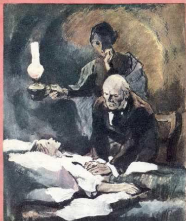
А.И. КУПРИН ЧУДЕСНЫЙ ДОКТОР

Куприн, А.И. Чудесный доктор /А.И.Куприн.-К.: Веселка, 1985.-16с.:ил.