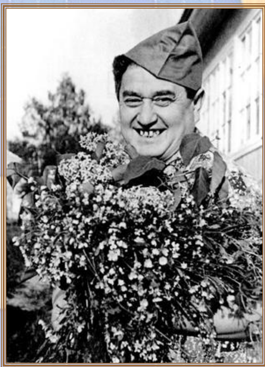
В. Драгунский в 40-е годы