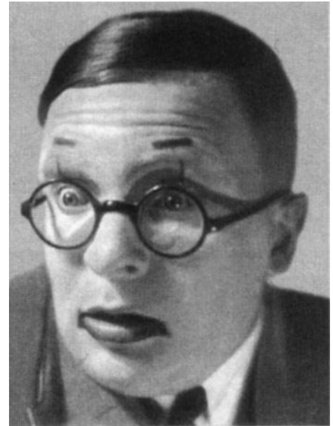
Максим Штраух в роли Победоносикова.