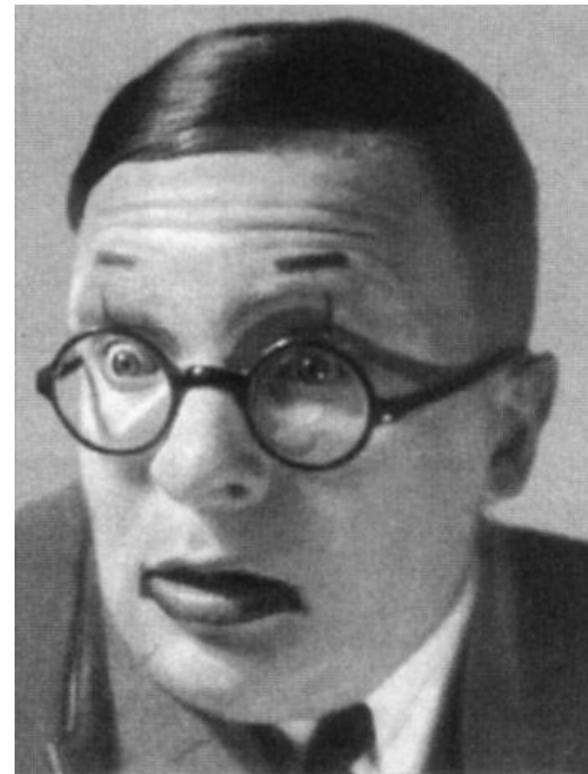
Максим Штраух в роли Победоносикова.