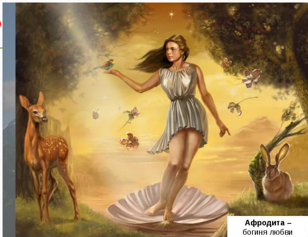
Афродита – богиня любви