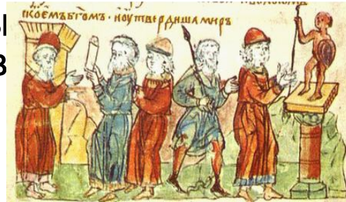
Заклчение договора князя Олега с греками