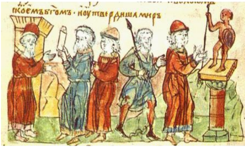
Заключение договора князя Олега с греками