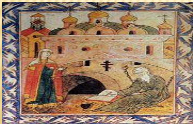
Боярыня Морозова навещает Аввакума в тюрьме

Аввакум – вдохновитель движения старообрядцев, проповедовал идеи сохранения старины, резко критиковал произвол властей. Своё «Житие...» он написал в Пустозёрской тюрьме в 1672-1675гг.